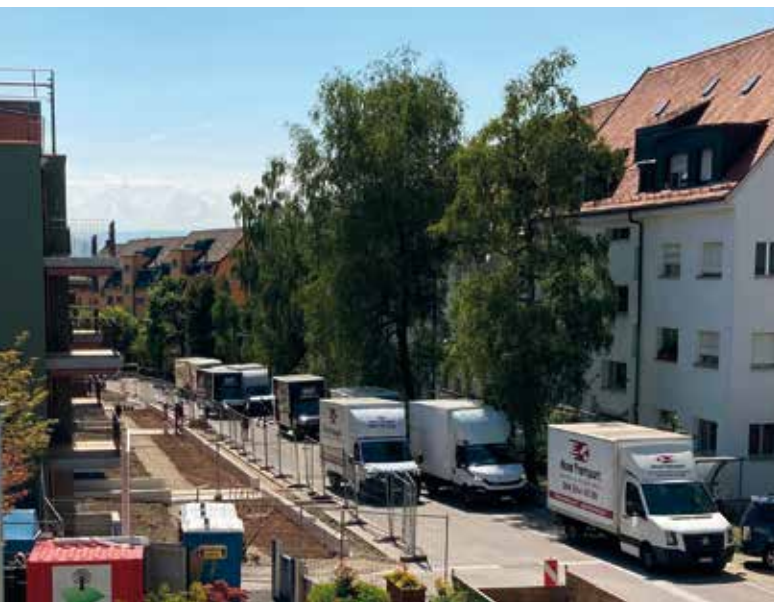
2. Zügeltag am Freitag 3.9.2021: Auf dem Bild sind acht Zügelteams bei der Arbeit zu sehen.

An insgesamt vier Tagen wurden die AWG, alle Wohnungen, Treppenhäuser, Keller und Technikräume von der BGF mit Unterstützung von arc, der Bauherrenbegleitung unter der Leitung vom Baumanagement Laternser Waser geprüft, kontrolliert und abgenommen. Damit ging der Neubau voll und ganz in den Besitz und in die Verantwortung der BG Freiblick über. Somit konnte auch die Wohnungsübergabe an die neuen Mieter*innen vollzogen werden.