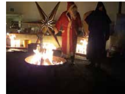
Alle Jahre wieder kommt im Illanzhof der Samichlaus zu Besuch.

Ein schöner Jahresausklang mit den Mitarbeitern. Danke für Euren täglichen Einsatz für den Freiblick.