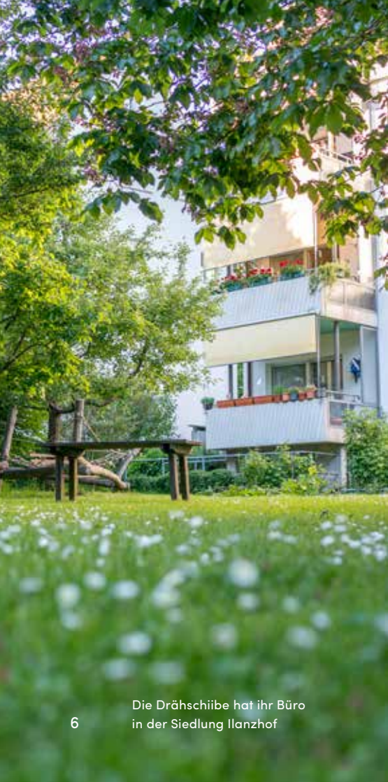
Die Drähschiibe hat ihr Büro in der Siedlung Illanzhof