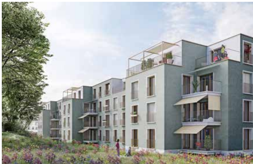
Visualisierung des Ersatzneubaus Stüssistrasse 58/66

Ende November konnte die Phase «Bauprojekt» abgeschlossen werden. Damit sind einige Pflöcke eingeschlagen. Es beginnt nun die Ausschreibungsphase, d.h. es werden immer mehr Details konkretisiert, die wich-