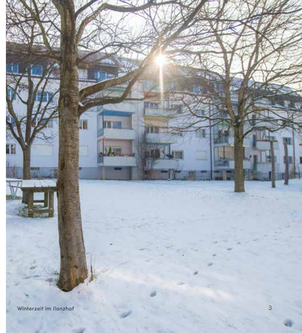
Winterzeit im Illanzhof