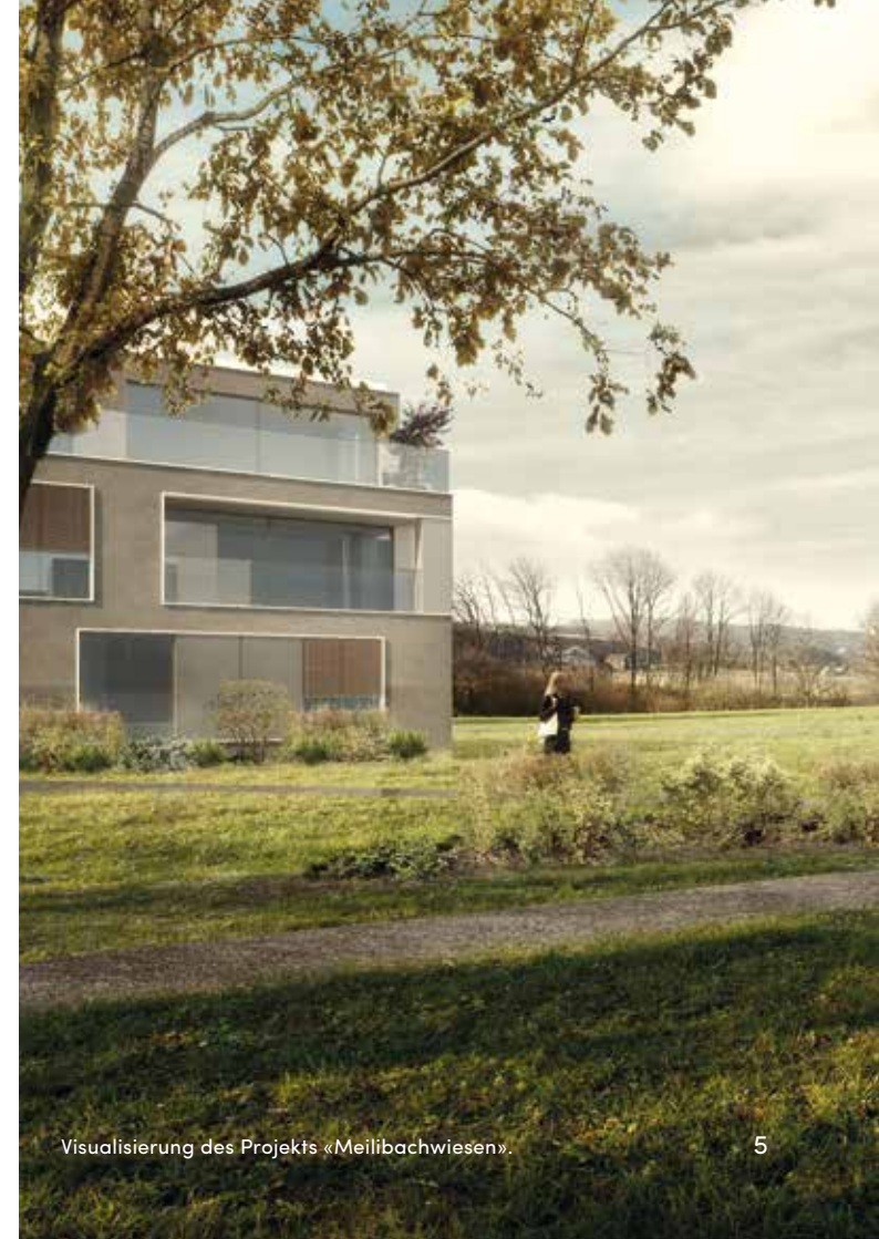
Visualisierung des Projekts «Meilibachwiesen».

Letztlich konnte unser Präsident mit der Verkäuferschaft einen sehr guten Deal aushandeln. Alles in Allem konnten die Gesamtkosten um 0,6 Millionen Franken, auf nunmehr 38,4 Mio. reduziert werden. In den Gesamtkosten sind gegen 750'000 Franken an Mehrwert durch Projektverbesserungen enthalten. Wir erwarten den Baubeginn im April 2019! Nun freuen wir uns sehr auf eine weiterhin positive Zusammenarbeit mit den Projektverantwortlichen zum Wohle unserer Genossenschaft.